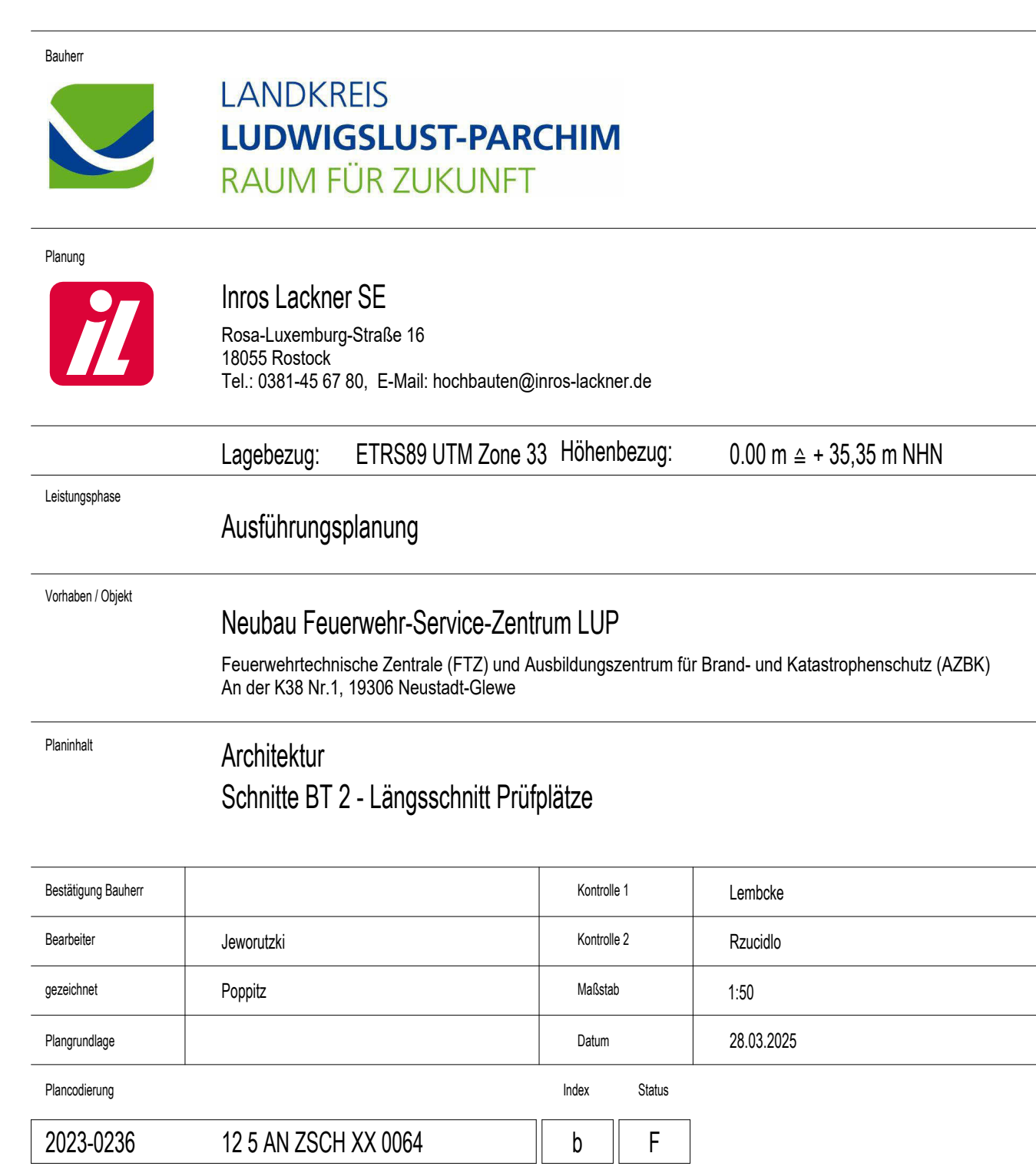
Schnitt 2.2 - Teil 2